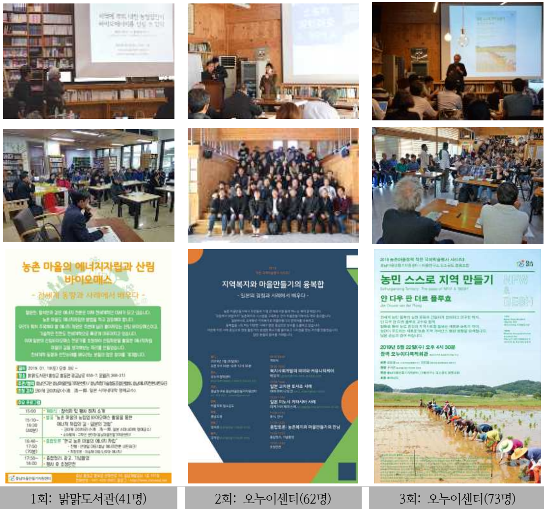
[그림 3-7] 2019년 국제학술행사 진행 모습