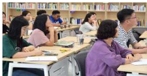
맞춤형교육 2차 홍보워크숍(20명)