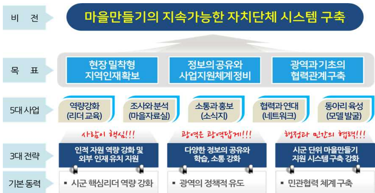
[그림 2-1] 충남마을만들기지원센터의 민선7기 비전과 목표, 전략 등