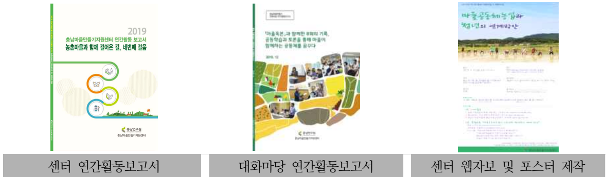
[그림 3-4] 연간활동보고서, 웹자보 제작 등 추진 현황