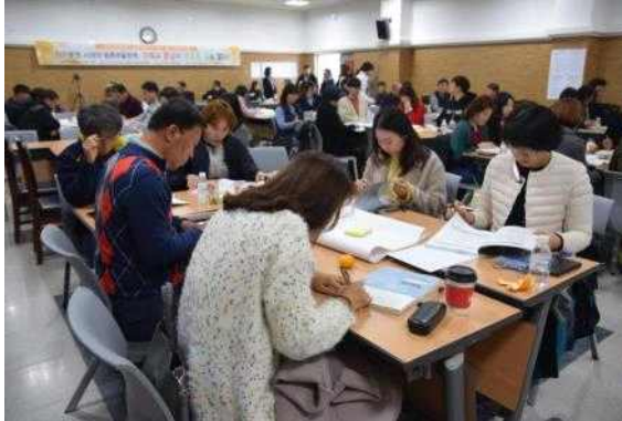
분임토론② “재정분권 시대의 농촌마을방향”