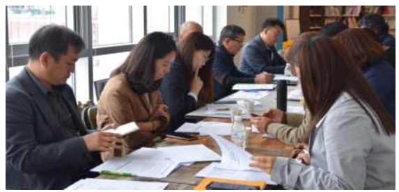
2019년 시군 센터 사무국장 정기회의(매월 1회, 대화마당 연계)