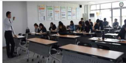
맞춤형교육 3차 문서작성(31명)