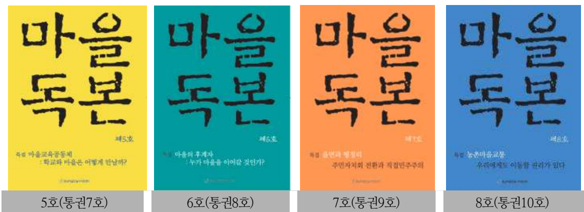
[그림 3-2] 2019년 마을독본 발간 현황(4회분 표지)