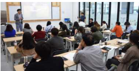
맞춤형교육 1차 홍보강의(33명)