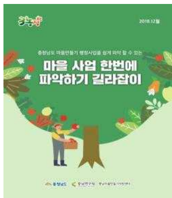
2018 길라잡이 표지