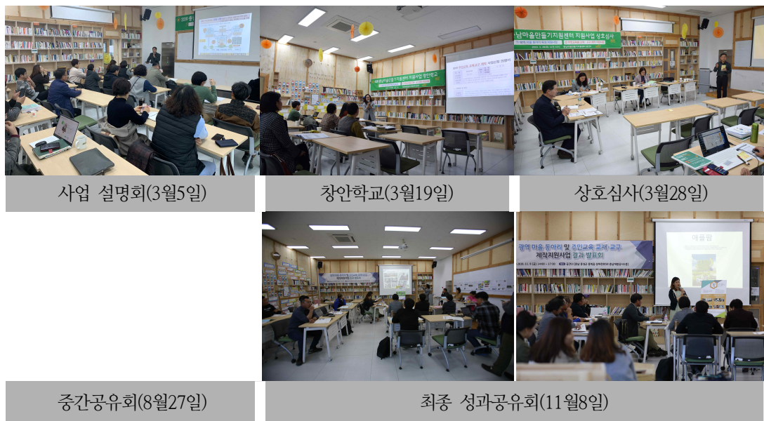
[그림 3-13] 2019년도 광역마을만들기 동아리 공모사업 진행 모습