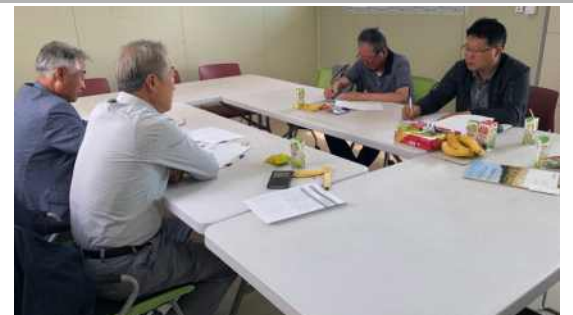
2019년 시군 마을만들기협의회 회장단 정기회의(매월 1회, 대화마당 연계)