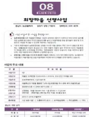
2018 길라잡이 내용