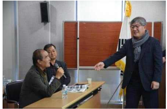
농촌마을정책 우수사례 발표(충남3, 전북3)