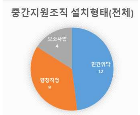
분임토론① “충남, 전북 중간지원조직 현황 및 쟁점토의”