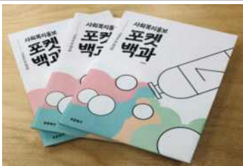
맞춤형교육 2차 홍보워크북