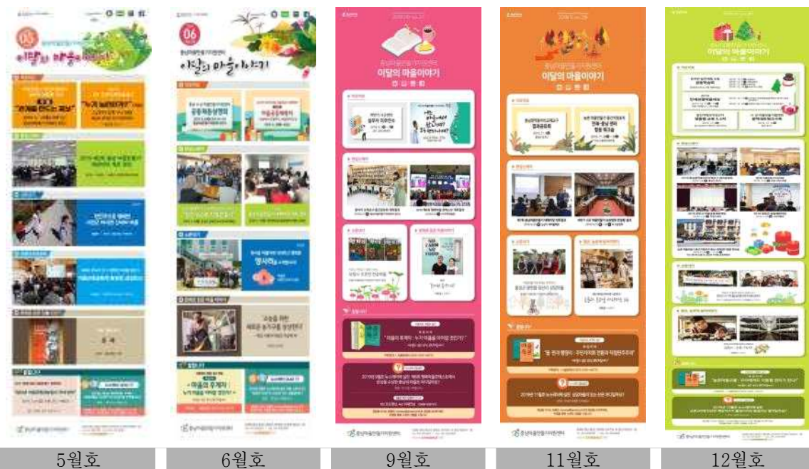
[그림 3-3] 2019년 뉴스레터 발간 현황(5회분 이미지)