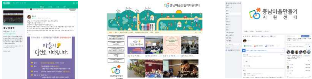
충남마을만들기지원센터 밴드 충남마을만들기지원센터 블로그 충남마을만들기지원센터 페이스북