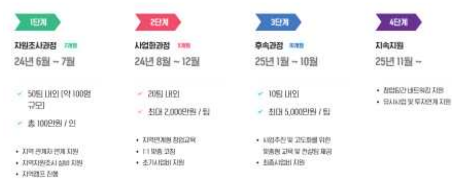
〈그림 4-1〉 서울특별시의 넥스트로컬 사업과정

자료: 넥스트로컬 누리집( http://seoulnextlocal.co.kr/ , 검색일자: 2024.10.02.)