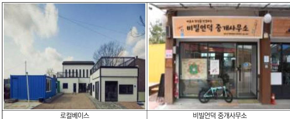
<그림 4-5> 완주군의 다음타운 대표 거점공간

다음타운의 대표 거점공간은 ‘로컬베이스캠프’와 ‘비빌언덕 중개사무소’다 (<그림 4-5> 참고). 청년마을목수협동조합 청년 5인과 다음타운 관계자들이 힘을 합쳐 공간 기획부터 제작, 페인트칠까지 직접 다음타운의 거점공간을 만들어 나갔다. 1층에는 사무공간에 ‘커넥터스랩’과 커뮤니티 공간이 ‘메이커스랩’, 커뮤니티 식당 ‘모여라 땡땡땡’이 있고, 2층에는 완주에 놀러오는 이들을 위한 ‘다음스테이’ 게스트하우스가 마련되어 있다. ‘(마을과 청년을 연결하는) 비빌언덕 중개사무소’는 지역과 청년들을 연결하며 청년들에게 필요한 정보를 공유하는 허브 공간 역할을 담당한다.