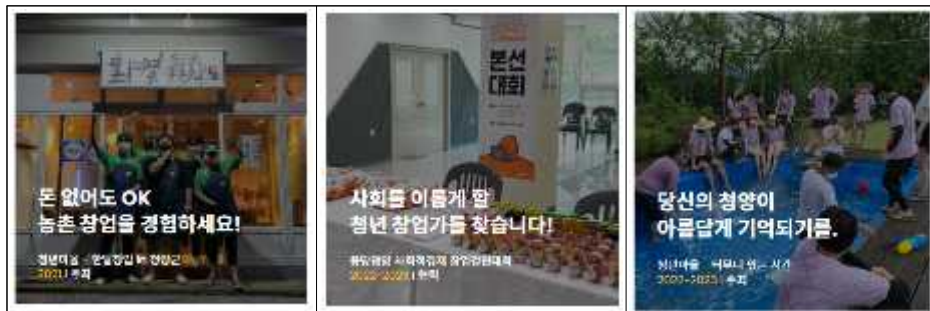
〈그림 4-2〉 청양군의 로컬몬스터 주요 프로젝트