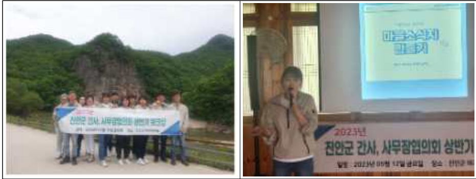
〈그림 4-6〉 진안군의 마을간사제도