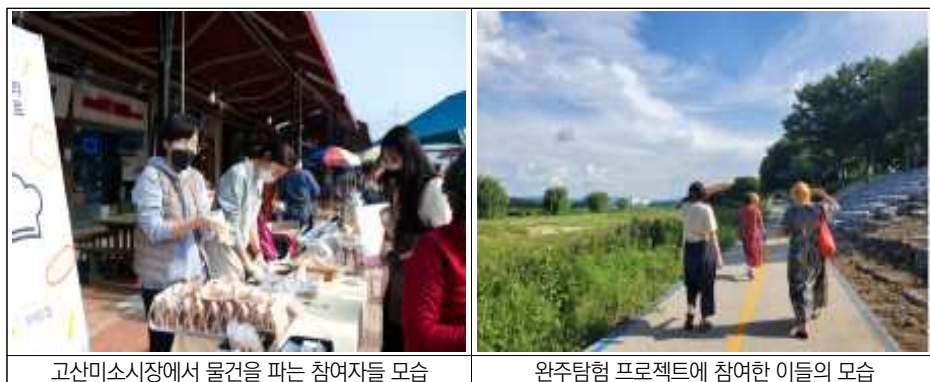
〈그림 4-4〉 완주군의 다음타운