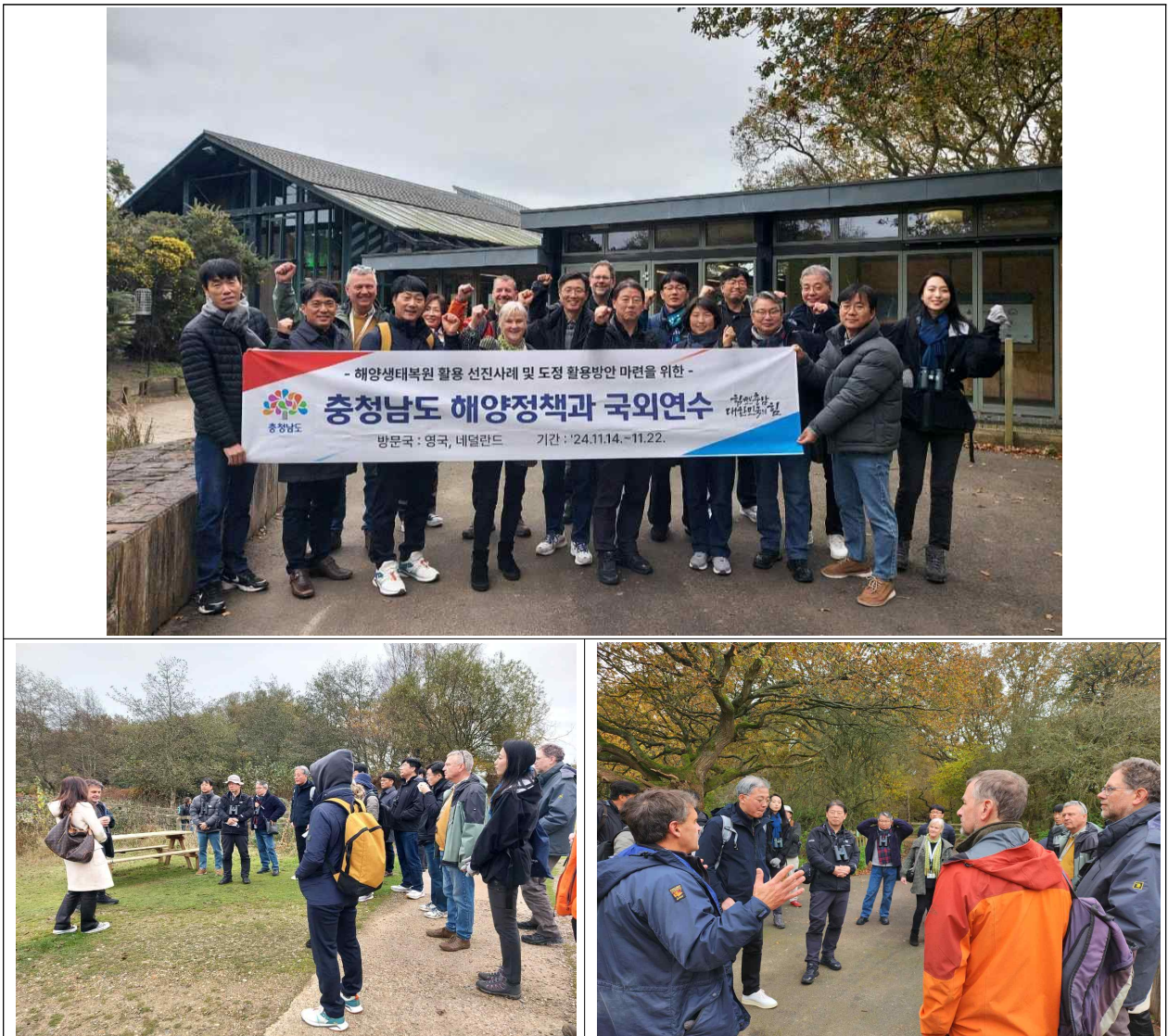
[Minsmere reserve 보호구역 사업 및 방문자센터 운영에 대한 설명]