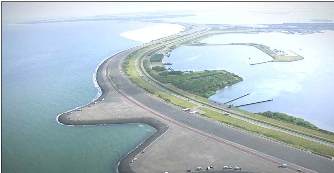
[그레블링겐 하굿둑 및 젤란드항 전경]