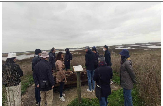
[Wallasea Island 복원사업 대상지 현장 탐방]