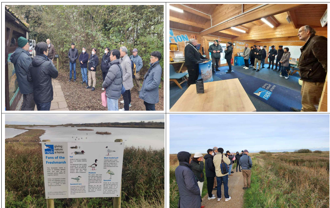
[Titchwell Marsh, RSPB 방문자센터 방문]