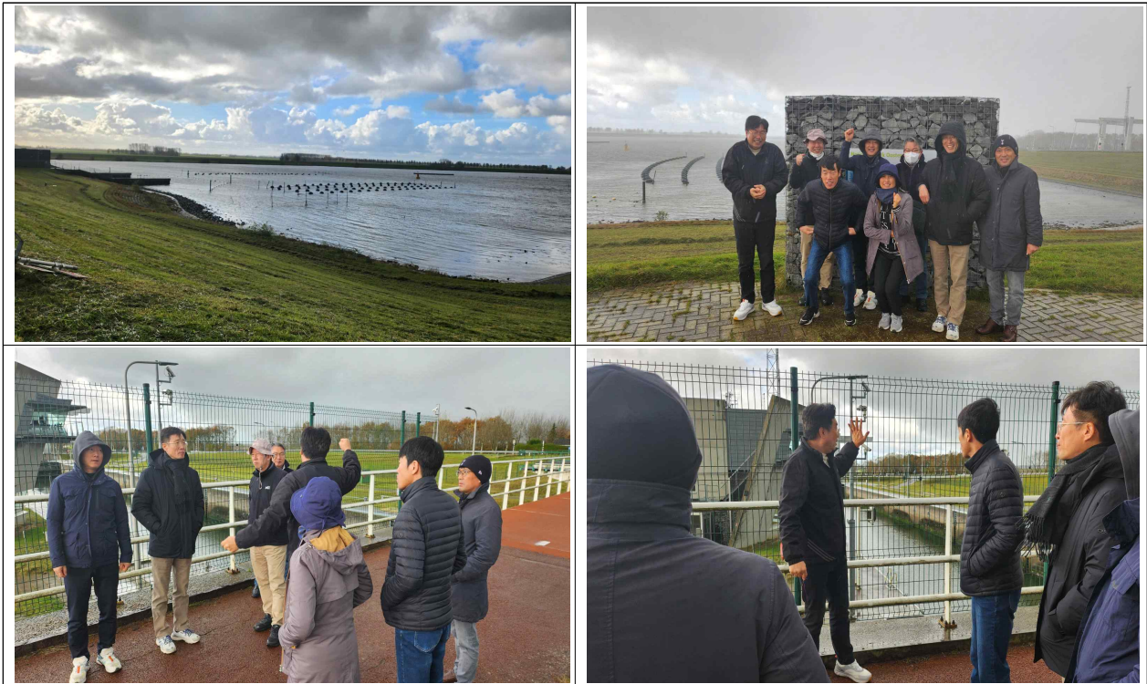
[휘어스호 해수유통구 및 통선문 운영에 대한 설명]