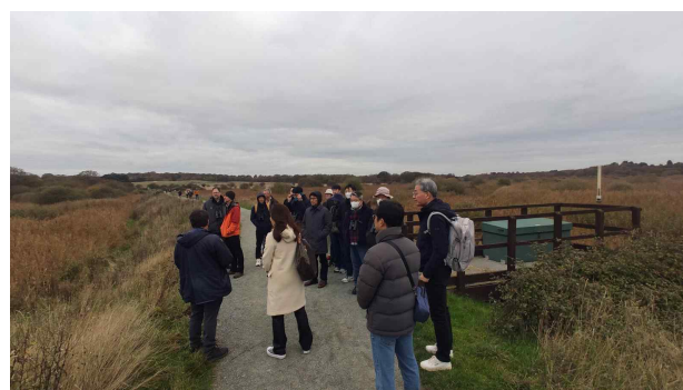
[Minsmere reserve 보호구역 사업 및 방문자센터 현장 탐방]