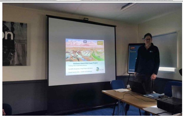
[Wallasea Island 복원사업 및 센터 운영에 대한 설명]