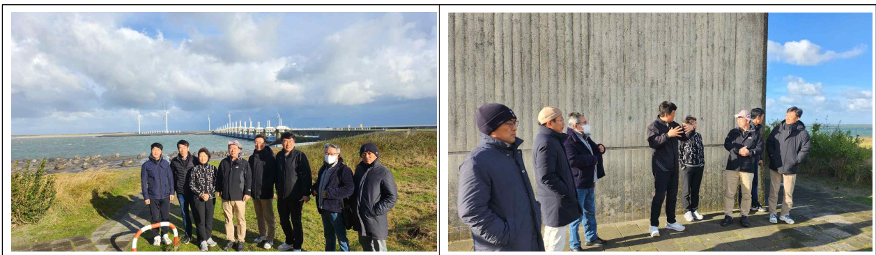
[오스터스켈트담 하굿둑 방문 및 운영현황 등 청취]