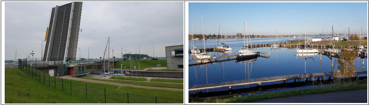
[통선문 및 도개교 운영 사례(좌), 하구호 내 내륙마리나 조성 사례(우)]