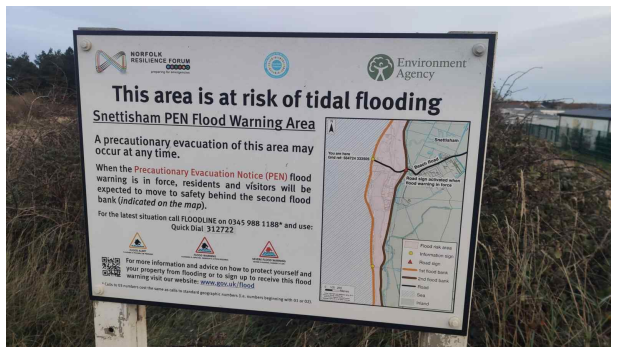
[Snettisham reserve, RSPB 갯벌 및 철새보호구역 방문]