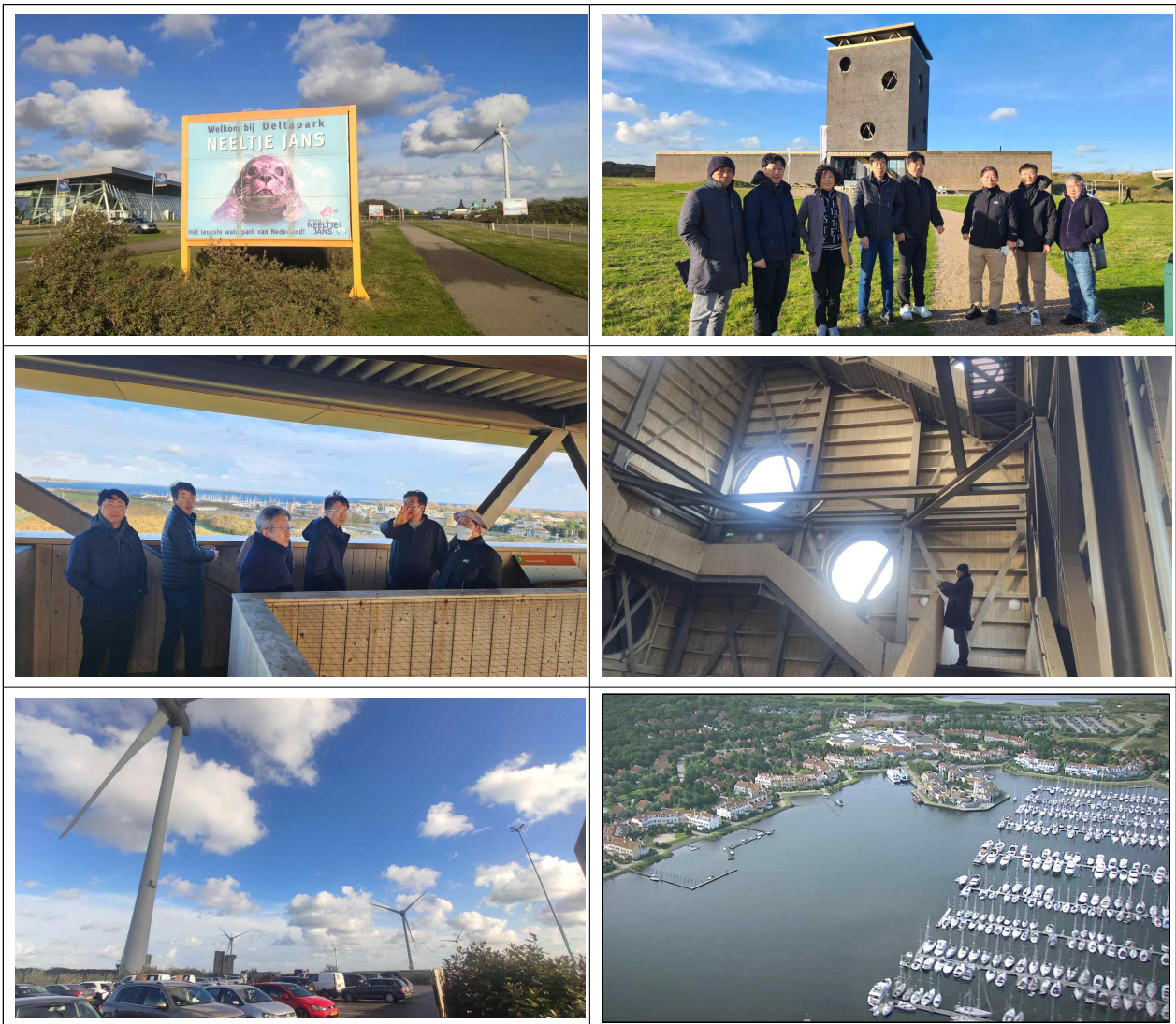
[젤란드항 전경, 주변지역 풍력발전단지, 해양관광단지 마스코트-물범, 친환경 휴게소 전경 등]