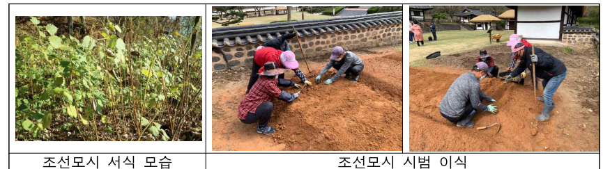
조선모시 서식 모습