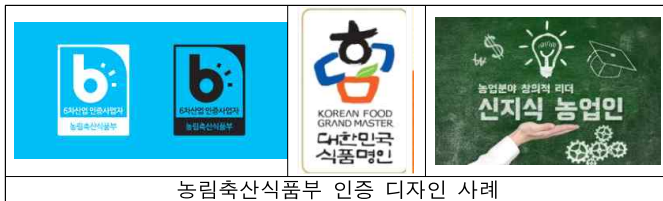
농림축산식품부 인증 디자인 사례