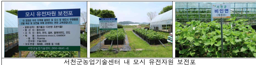
서천군농업기술센터 내 모시 유전자원 보호포