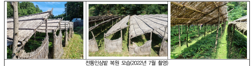
전통인삼밭 복원 모습(2022년 7월 촬영)