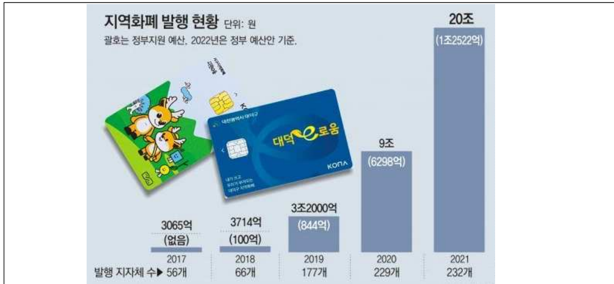
[그림 2] 전국 지역화폐 발행 추이 (단위: 억원)