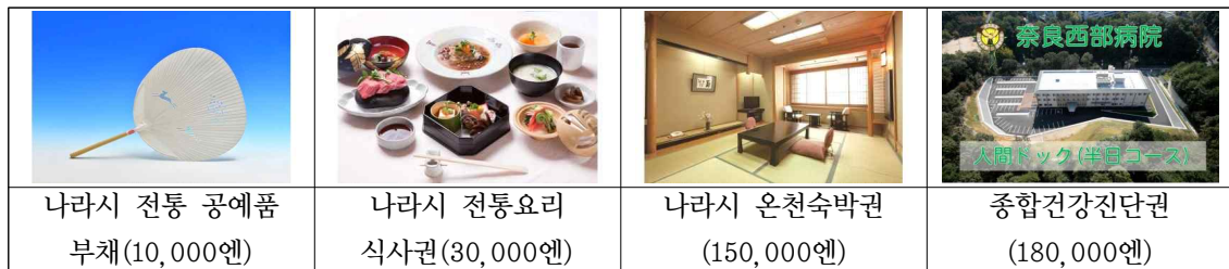
[표 8] 나라시 고향납세 답례품 예시