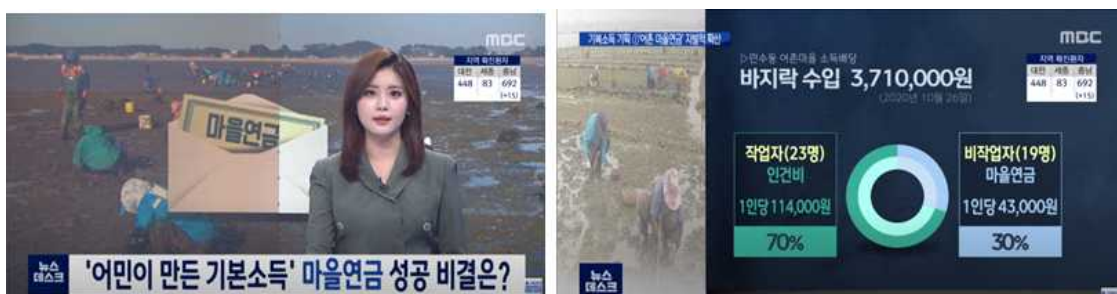
[그림 5] 충남 어촌마을(어촌계) 마을연금 보도자료