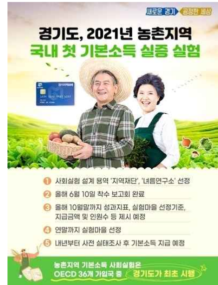
[그림 4] 경기도 농촌기본소득 실증실험 홍보자료