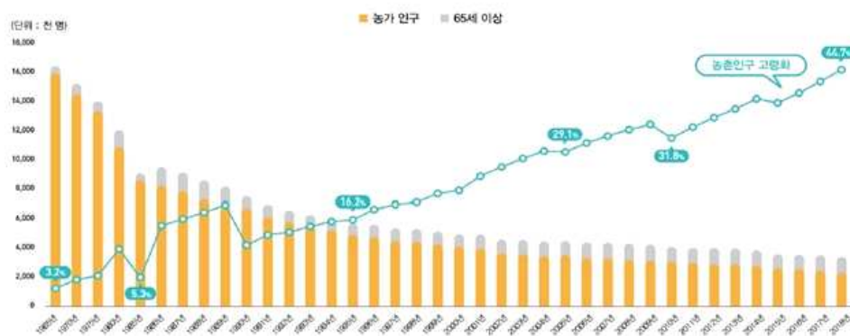
[그림 1] 농가인구 감소와 고령화 증가 추이