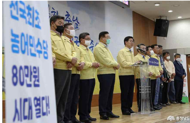
[그림 3] 충청남도 농어민수당 지급 계획 발표(2020.6.4.)