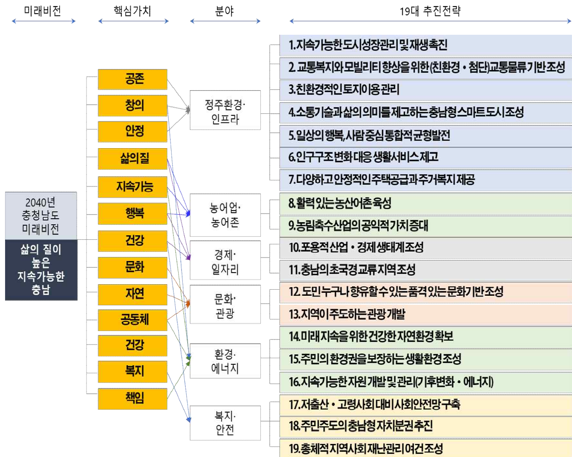
[그림 II-2] 제4차 충청남도종합계획(2021~2040) 기조