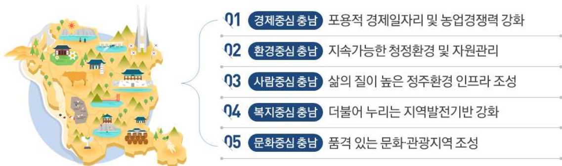
제4차 충청남도 종합계획의 발전목표 및 추진전략

자료 : 충남연구원, 제4차 충청남도 종합계획(안) 2020-2040, 2020