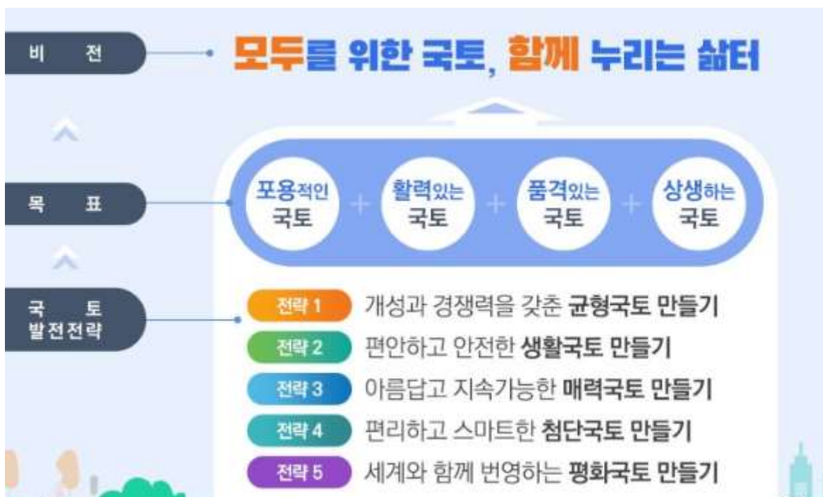
제5차 국토종합계획(안)의 비전, 목표, 전략