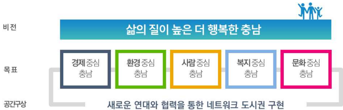
제4차 충청남도 종합계획의 미래비전과 발전목표

자료 : 충남연구원, 제4차 충청남도 종합계획(안) 2020-2040, 2020