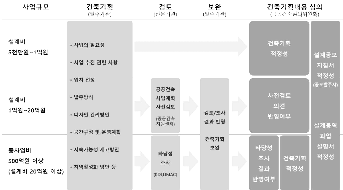
그림 1. 사업규모별 건축기획 업무절차 및 심의내용