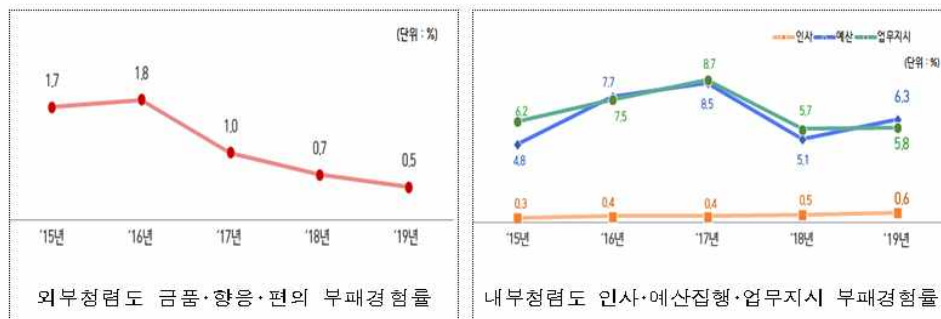
최근 5년 외부·내부 청렴도 부패경험률 (2015년~2019년)