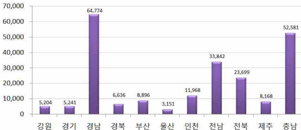
시도별 낚시어선 매출액 추정(해양수산부, 2017)