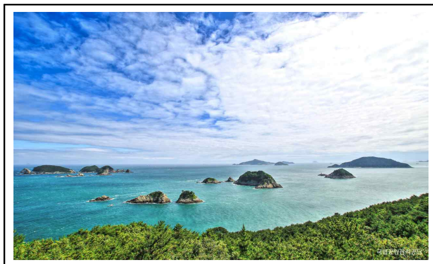
그림 6. 한려해상_대소병대도