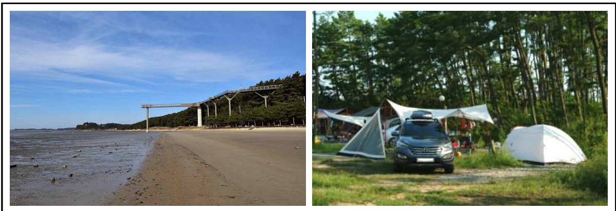
그림 10. 서천 송림산림욕장(왼쪽)과 산온리 해안방풍림 캠핑장(오른쪽)