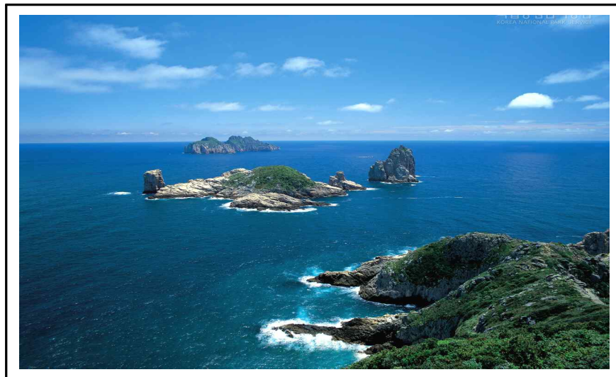
그림 5. 다도해상_백도