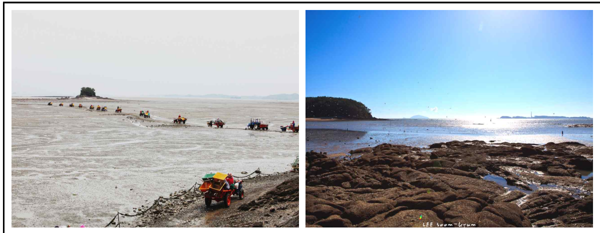
그림 7. 갯벌로 채워진 태안해안(왼쪽)과 물로 채워진 서천_월하성(오른쪽)