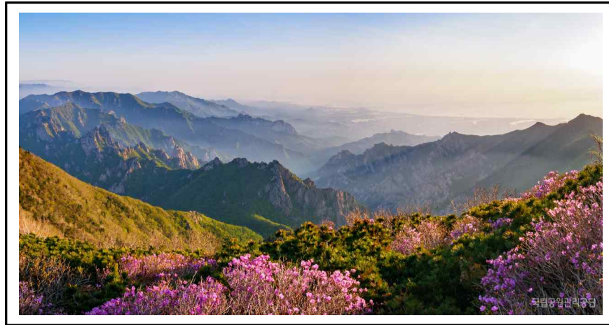
그림 3. 설악산