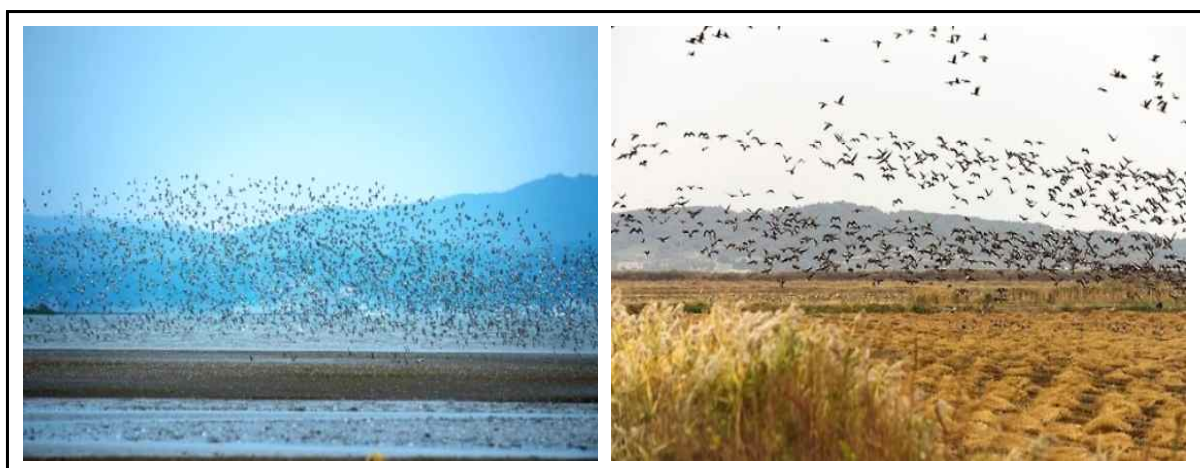
그림 8. 갯벌을 누비는 철새(왼쪽)와 논습지를 누비는 철새(오른쪽)