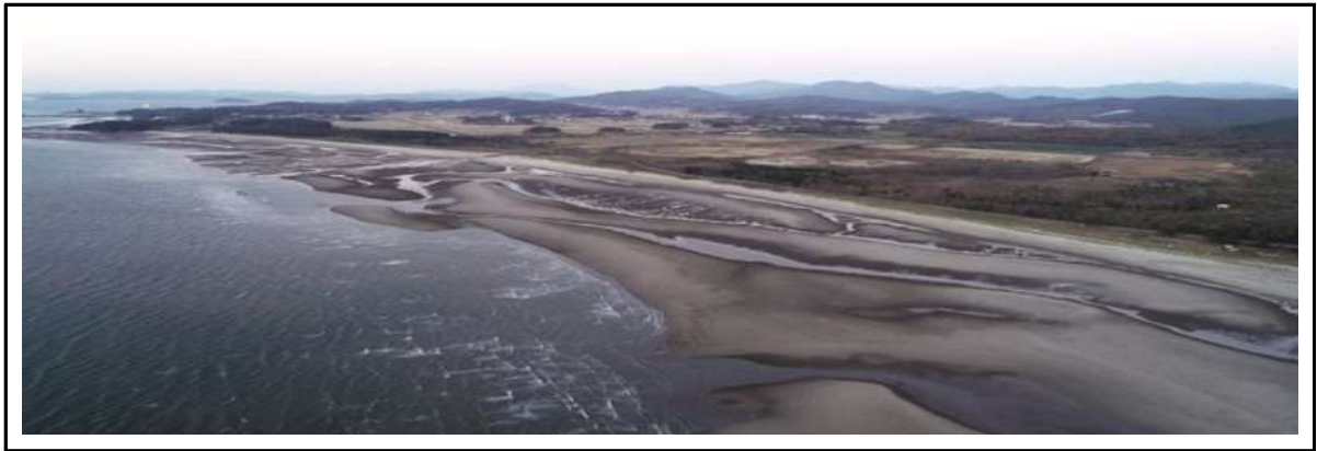
그림 9. 소항사구와 배후습지