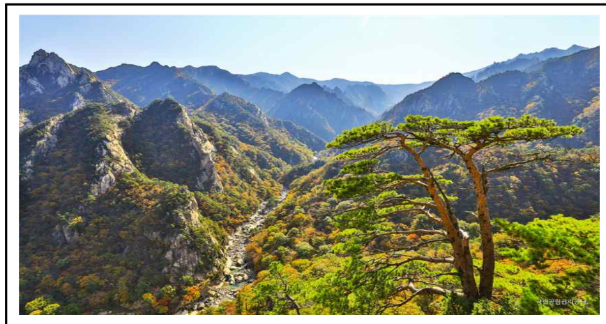
그림 4. 설악산