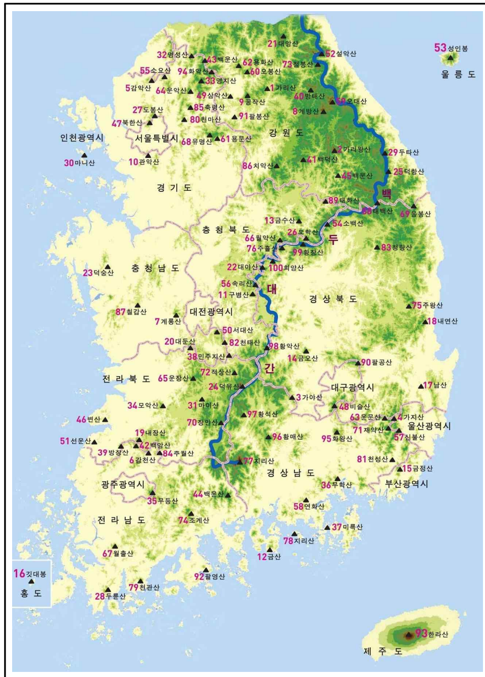
그림 2. 100대 명산 분포도