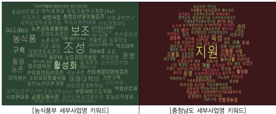
[그림 2] 농식품부 및 충청남도의 세부 사업명 키워드 분석