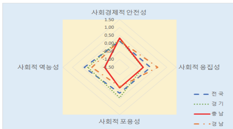
〈그림 3〉 사회의 질 영역별 비교: 전국, 경기, 충남, 경남