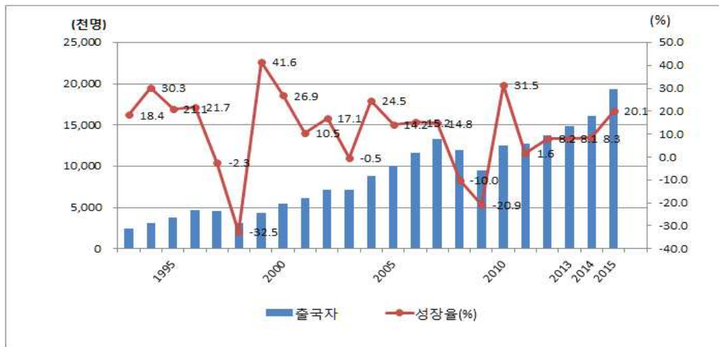
[그림-2] 내국인 출국자 추이 (1990-2015)