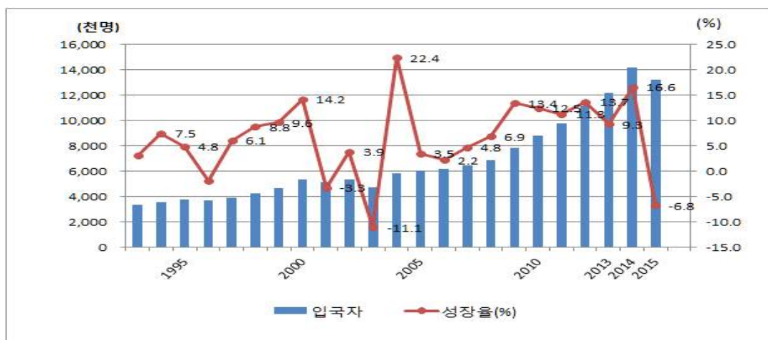
[그림-1] 방한 외래객 입국 추이