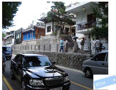
< 가로시설물(팬스)개선 후 >