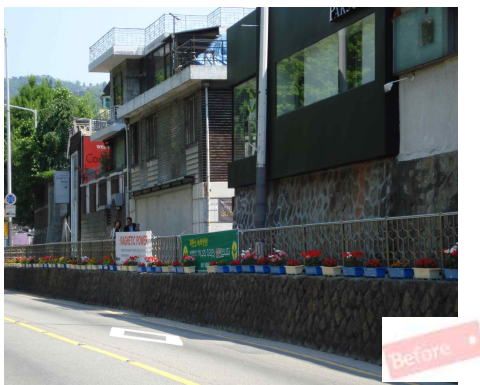
< 가로시설물(팬스)개선 전 >