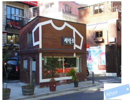
< 간판개선 후 >