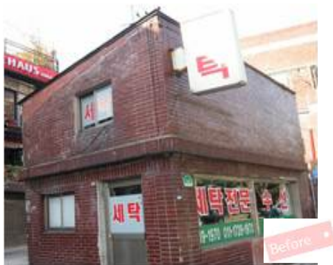
< 간판개선 전 >