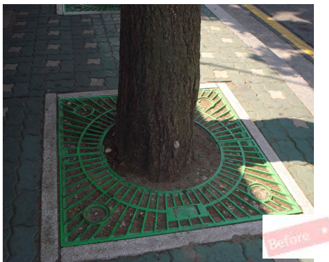
< 가로시설물(수목보호대)개선 전 >