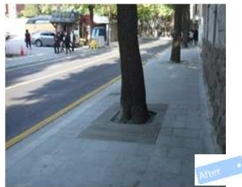
< 가로시설물(수목보호대)개선 후 >