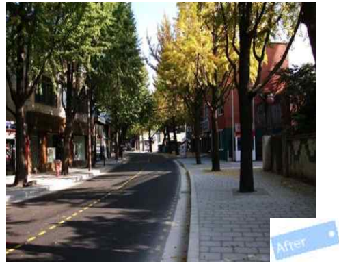
< 가로시설물(보도, 전선 등)개선 후 >