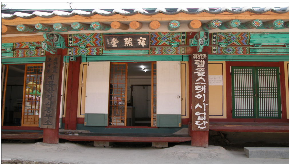
<갑사 템플스테이사업단의 모습>