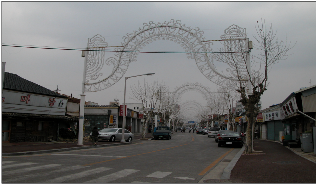
<남원시의 시가 야경조성 모습>